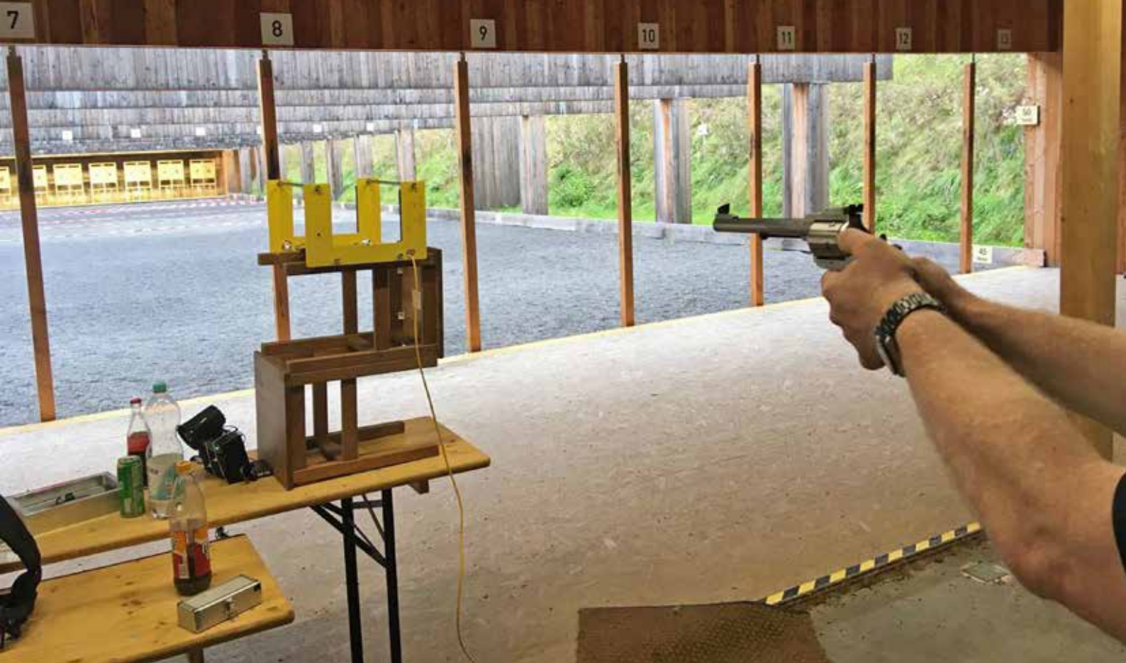
Geschwindigkeitsmessung Super Magnum.