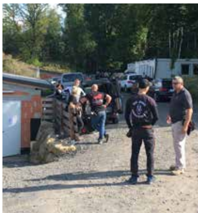
Entspanntes Fachsimpeln vor den Schießständen.

die Startgelder gesenkt wurden. Hoffentlich wird es im nächsten Jahr wieder besser planbar. Wir bedanken uns bei euch allen und hoffen, dass wir uns nächstes Jahr alle gesund wiedersehen!