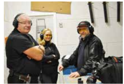
Wartezone das nächste Rennen ist schon vorbereitet.