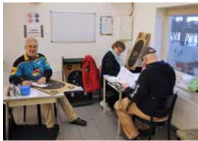
Auswertung immer mit 3-4 Personen besetzt.

...und hier zum Vormerken für 2022, dann gibt es die 2. Schleswig-Holstein-Trophy mit einer kleinen Überraschung. Wir freuen uns schon auf Euch.