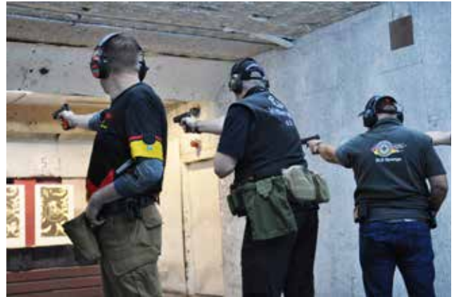
Hier NPA-C, die besondere Herausforderung: 6 Schüsse in 8 Sekunden im einhändigen Anschlag.

ausforderung an Planung, Organisation, Personaleinsatz und Logistik.