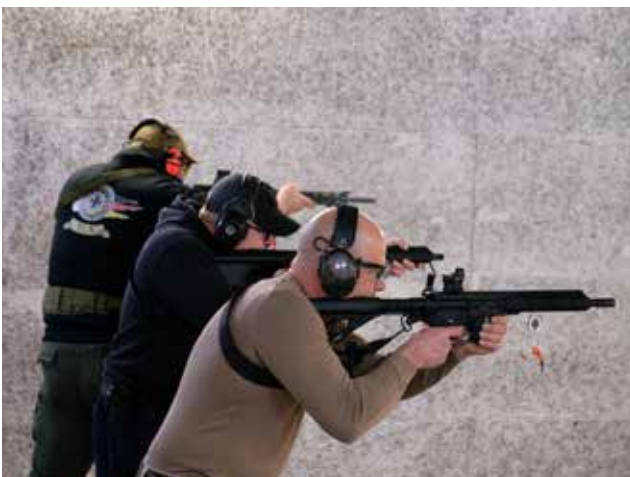
EPP Carbine / EPP Rifle.