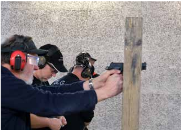
EPP / EPP Produktion.

An diesen zwei Tagen war es durchweg eine positive Atmosphäre. Die Teilnehmer haben sich ausgetauscht, Ausrüstung verglichen, Erfahrungen weitergegeben, ein schönes Mitein-