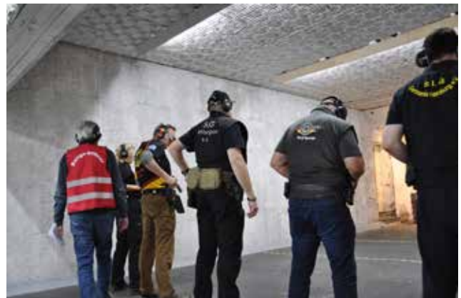
Hier ein paar Bilder vom Kurzwaffenstand 25 Meter.