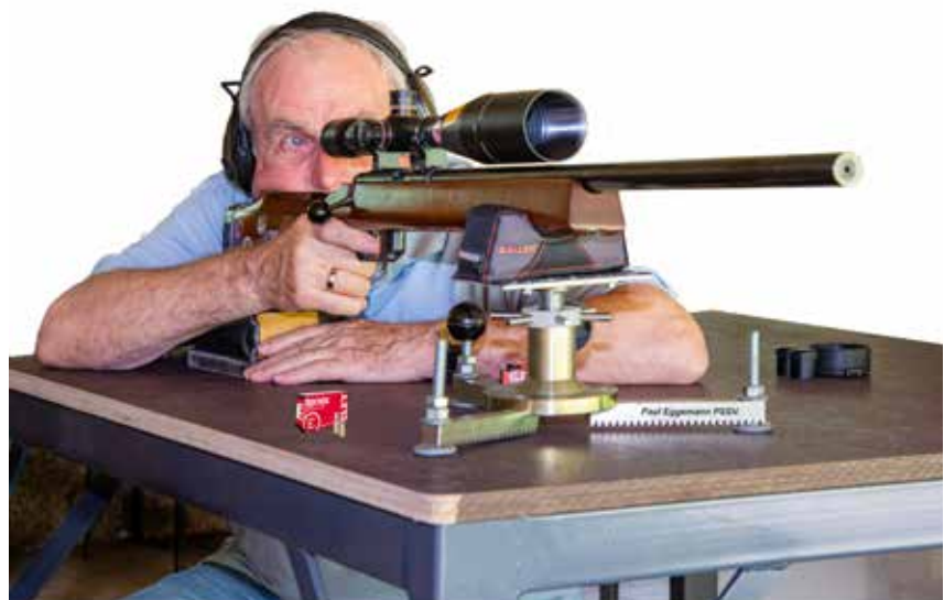
Anschlag KK Standard

Stellung sportlich vertretbar ist. Seine Feststellung: „Durch das sitzende Schießen konnte ich keine Verbesserung meiner Schießergebnisse erzielen. Ich halte die Wertung bei Wettkämpfen unabhängig von der Stellung für gerechtfertigt.“