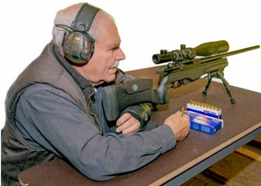
Anschlag sitzend ZG1 mod. B

mit einem Zweibein schießen. Das Gewehr wird fest eingezogen, die Handposition unter dem Hinterschaft kann so in der Höhe verändert werden, dass das Ziel anvisiert werden kann und die stabile Position erhalten bleibt.