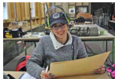
Die sympathische Auswertung