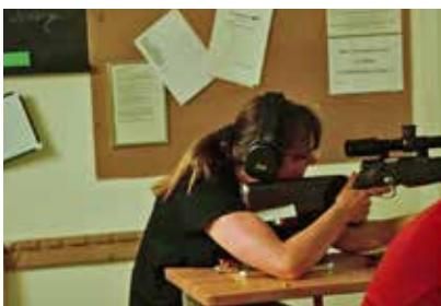
ZG5 im Wettkampf