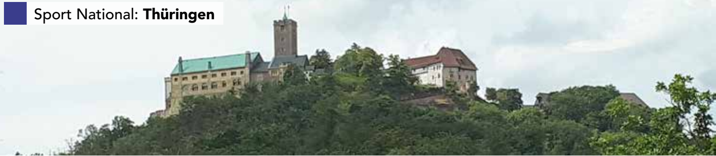
Die Wartburg in Eisenach, eines der bekanntesten Wahrzeichen Thüringens