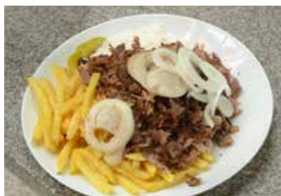
Für das leibliche Wohl war bestens gesorgt