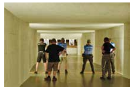
Schützen im Wettkampf PP1