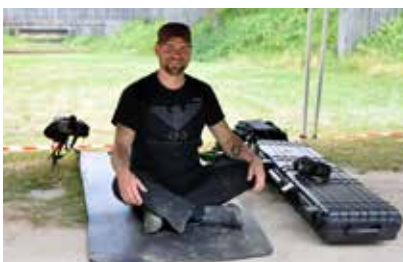
Warten auf den Start