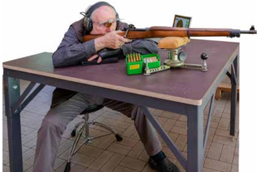
Anschlag sitzend DG1 und DG2

Bei der Disziplin DG2 darf die Waffe (hier eine Remington 1903 A3) an der Schulterstütze nur mit der Hand unterstützt werden. Ich persönlich lege die Schulterstütze auf dem Handrücken auf. Der Schießhandschuh mildert den Druck (siehe Foto oben). Ich bevorzuge diese Haltung gegenüber dem Anschlag, bei dem die Hand den Hinterschaft unterstützt, aber den Schießtisch nicht berührt.