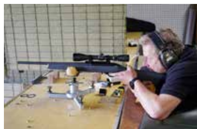
Langwaffe ZG5 und ZG6

dedisziplinen mit der Kurzwaffe im Einzel starke Punktzahlen und waren mit ihren Mannschaften fast immer