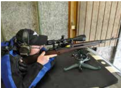
ZG 4 .308