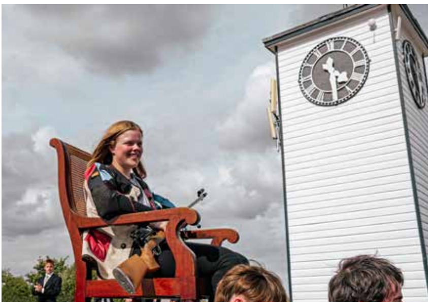
Siegerin des Queen's Prize