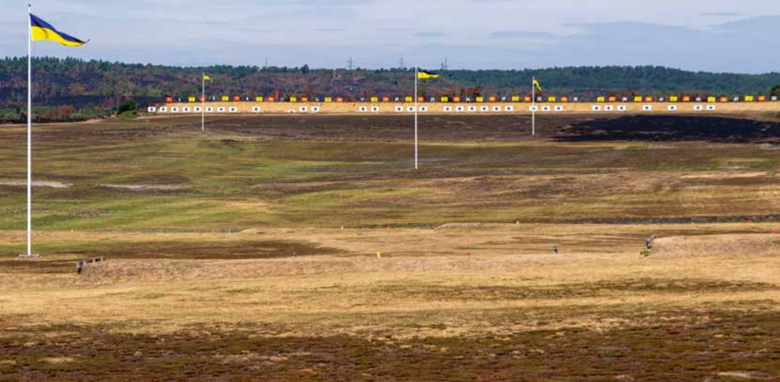
Die Stickle-down-Range (900x & 1000x-Yards)