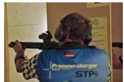
Schützen im Wettkampf .223