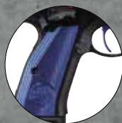
Blue Nr. 2009991