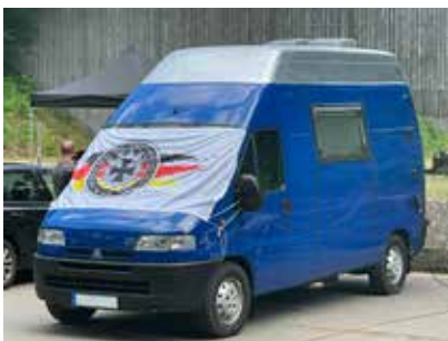
Anmeldung und Auswertung