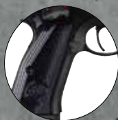
Black Nr. 2000006