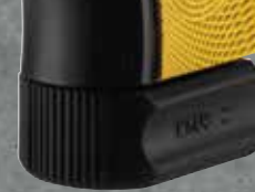
Gold Nr. 2009969