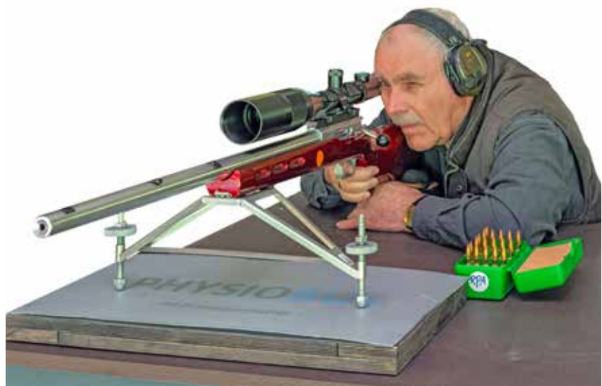
Anschlag sitzend FTR

Bei der Disziplin ZG1 mod. B2 (Foto rechts oben) sind Gewehre zugelassen, die in einer regulären Armee, bei der Polizei oder der Zollverwaltung als Scharfschützengewehre eingeführt wurden (z.B.: Rem 700P, SSG 3000, Sako TRG 22). Bei dieser Disziplin kann ich aufgelegt auf einem Sandsack oder wie auf dem Foto