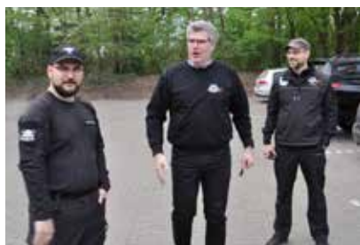
Eintreffen der Teilnehmer