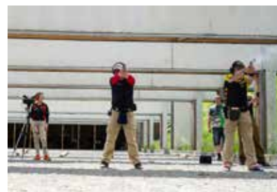
Schützen von vorn