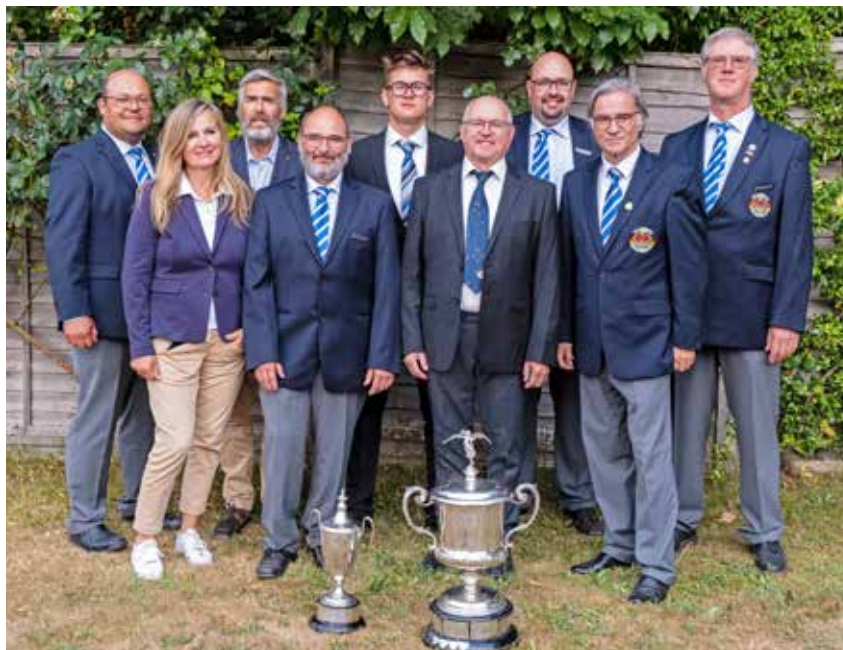
Foto des Nationalteam mit Pokalen