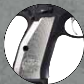
Silver Nr. 2009990

Gewicht ohne Magazin: 1.164 g Gewicht inklusive Magazin: 1.270 g