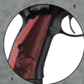
Red Nr. 2009944